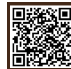
รายละเอียดเพิ่มเติมของหลักสูตร