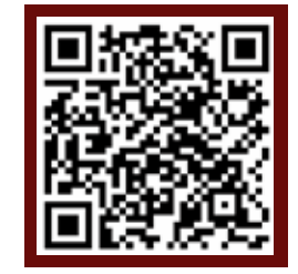
รายละเอียดเพิ่มเติมของหลักสูตร