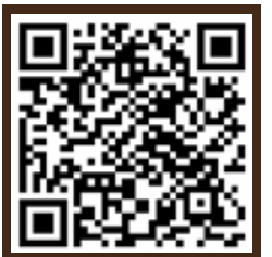
รายละเอียดเพิ่มเติมของหลักสูตร