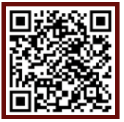
รายละเอียดเพิ่มเติมของหลักสูตร