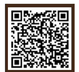
ขั้นตอนสมัครและเอกสารหลักฐาน